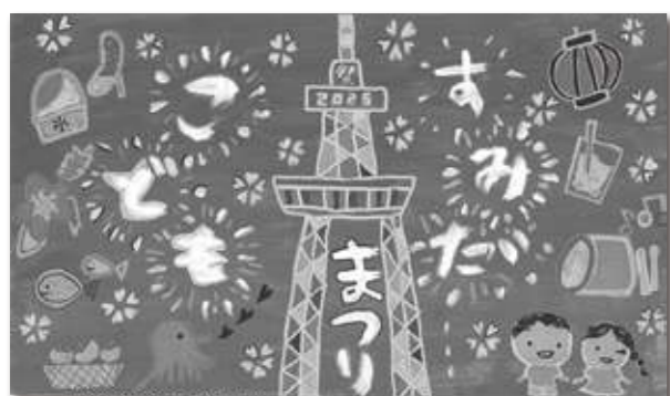
「みんなでワイワイ! 心がハイハイ!すみだまつり!」