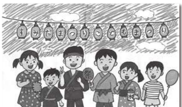
「青空の下のまつり」