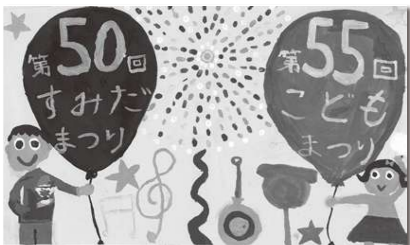
「みんなとついでに遊びまわろう!」