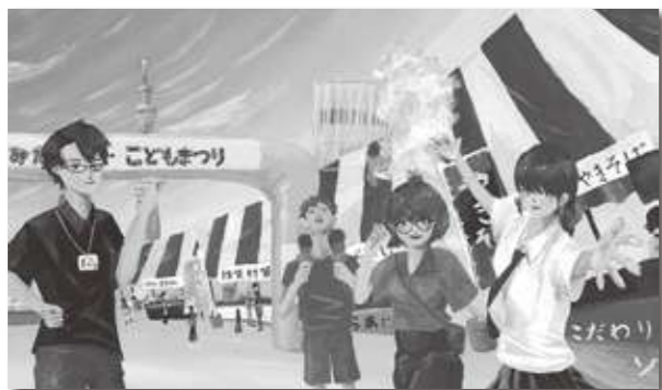
「おいでよ!すみだまつり」