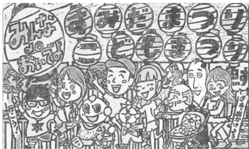
「みんなdeおいでよ! すみだまつり・こどもまつり」